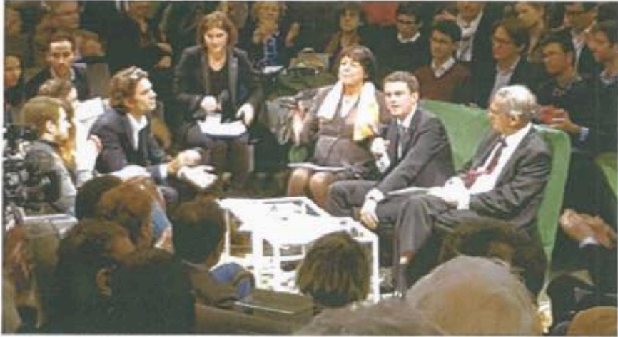
Le 26 novembre 2016: la séance inaugurale des Rencontres Capitales, avec le Premier ministre Manuel Valls

Publié le 02-12-2016 • Modifié le 02-12-2016 à 15:14