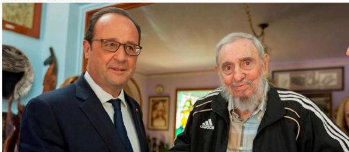
François Hollande et Fidel Castro, lors d'une rencontre à Cuba le 11 mai 2015.

"Fidel Castro était une figure du XXe siècle" a déclaré le président, avant de rappeler que la France a toujours dénoncé ses atteintes aux droits de l'Homme.