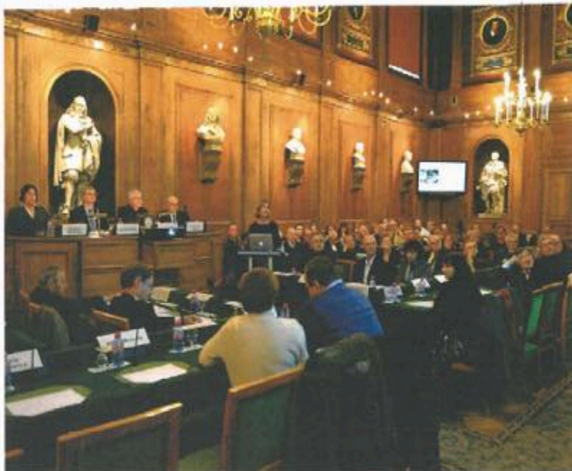
Séance publique de l'Académie des sciences.